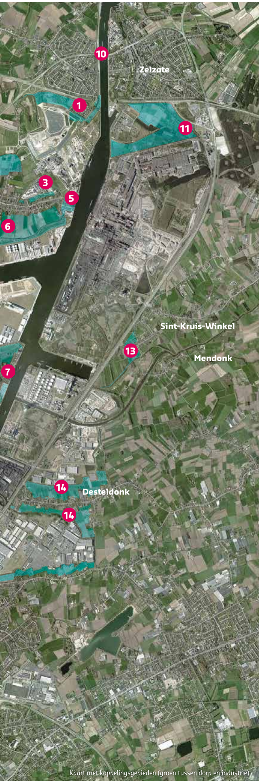
Kaart met koppelingsgebieden (groen tussen dorp en industrie)